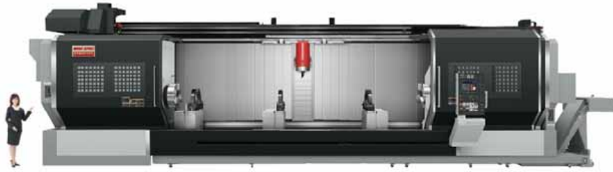
図1. 外観(NT6600 DCG/6000BS)