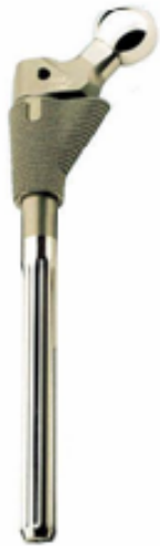
図 2. 対象ワーク事例(人工骨)