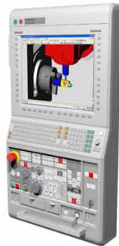
図 3. MAPPS IV + ESPRIT